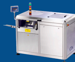
Redresseur automatique de flacons avec trémie (grande capacité)

CDA - 6 rue de l'Artisanat ZI de Plaisance 11100 Narbonne - +33 (0)4 68 41 25 29 - www.cdafrance.com