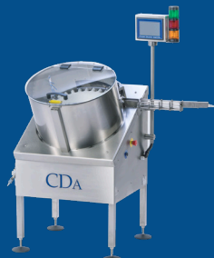
Redresseur automatique de flacons