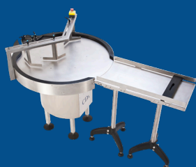
Table d'alimentation rotative